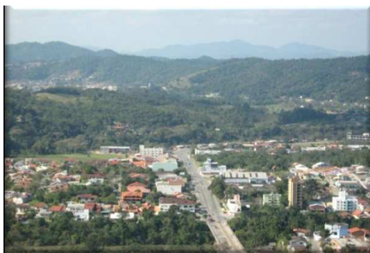
Vista parcial do bairro

Em 1980, o Vorstardt tinha 973 residências; 1.166 em 1991; 1.572 em 2000. A estimativa para 2010 é de 1.814 residências.