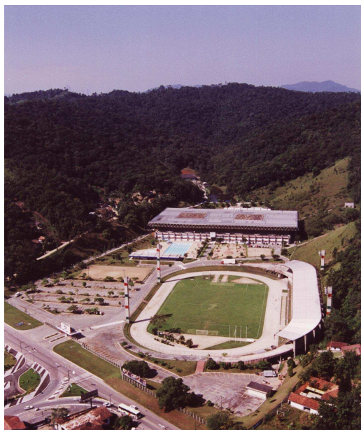
Centro Desportivo Bernardo Wolfgang Werner – SESI

Em um terreno, desapropriado pela prefeitura, foi construído o Centro Desportivo Bernardo Wolfgang Werner do SESI, considerado o maior do Sul do Brasil, cuja inauguração oficial aconteceu em 18 de julho de 1986.