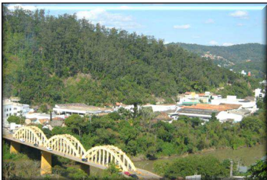
Com o Hospital Santo Antônio à direita