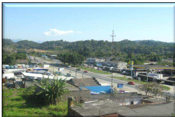
Bairro Badenfurt – imediações do entroncamento da BR-470 e SC-418

intermunicipais, encontram-se grande número de estabelecimentos voltados à indústria, ao comércio, à prestação de serviços e moradias.